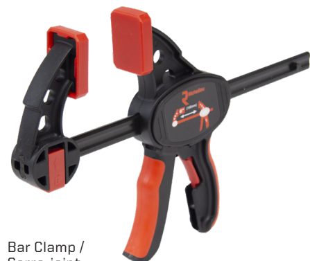
Bar Clamp / Serre-joint