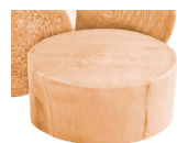
Birch / Merisier

Pièces en bois sont fabriquées à partir de bois dur qui peut être peint ou teint. Pour couvrir ou dissimuler les trous de vis.