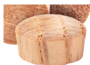
Oak / Chêne