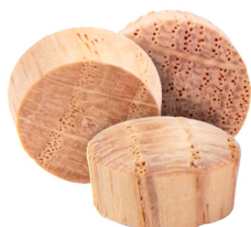
Round Head / Tête ronde