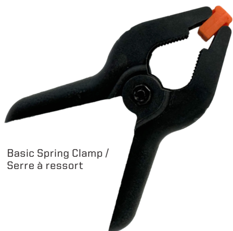
Basic Spring Clamp / Serre à ressort

Différents types de serres qui servent à maintenir et fixer des pièces de bois collées ensemble pendant le durcissement de la colle.