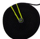
Band Clamp / Serre à bande