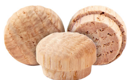
Button / Bouton