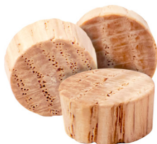
Flat Head / Tête plate