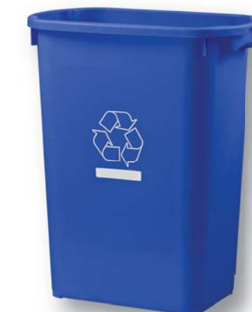
06468 41 L/11 Gal Recycle Bin Benne de recyclage 41 L/11 gal