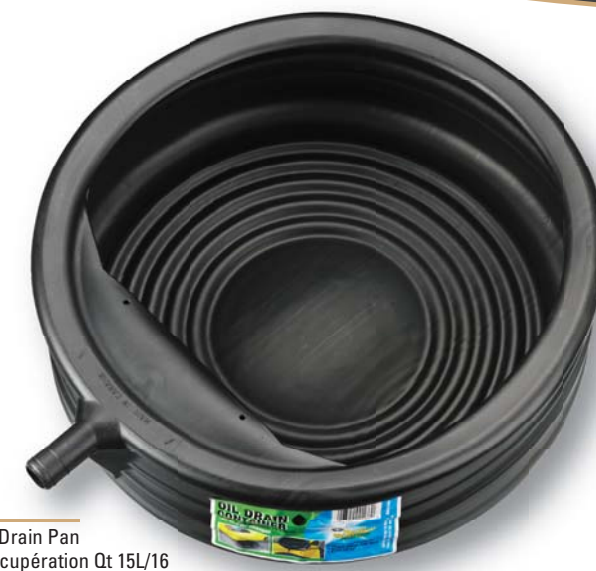
03894 15L/16 Qt Drain Pan Bac de récupération Qt 15L/16