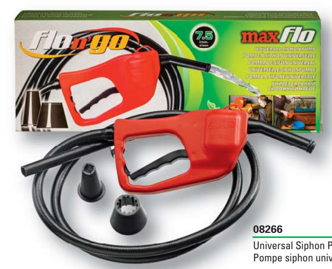
08266 Universal Siphon Pump Pompe siphon universelle