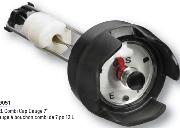
09051 12L Combi Cap Gauge 7" Jauge à bouchon combi de 7 po 12 L