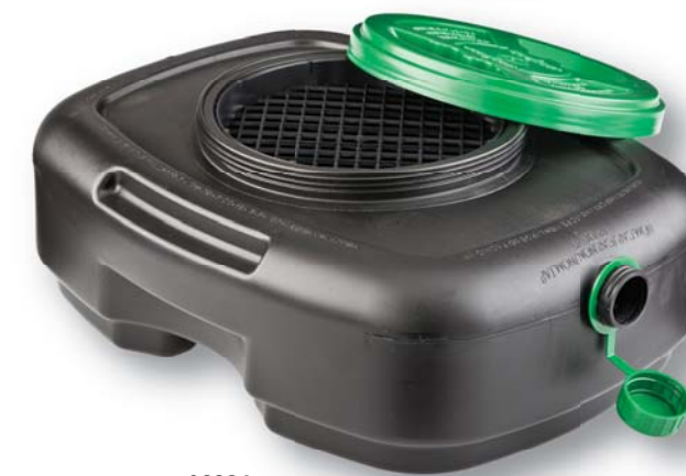
06984 11.4 L/12 Qt Drain Container Récipient de récupération Qt 11,4 L/12