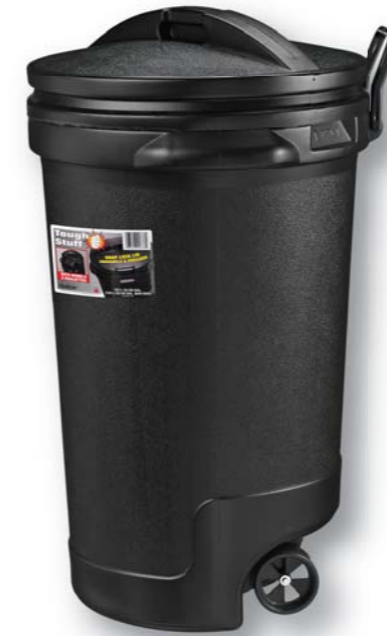
03328 121 L/32 Gal Garbage Can with Wheels Poubelle 121 L/32 gal avec roues