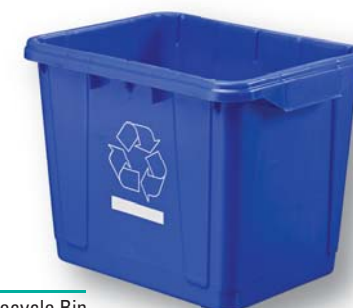
06391 27 L/7 Gal Recycle Bin Benne de recyclage 27 L/7 gal