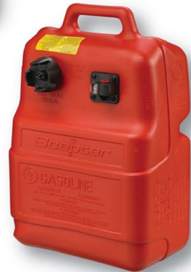
03781 OEM Choice! 6.6 Gal/25L Scepter C/W Gauge Option OEM! Scepter 6,6 gal/ 25 L avec jauge