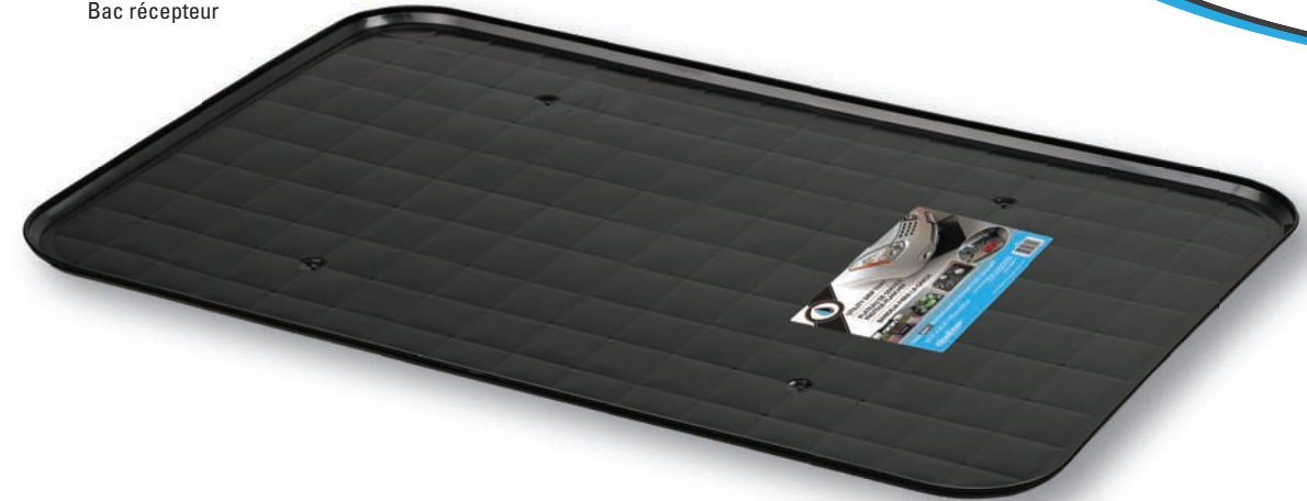
06951 Drip Tray Bac récepteur