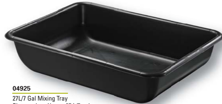
04925 27L/7 Gal Mixing Tray Plateau de mélange 27 L/7 gal