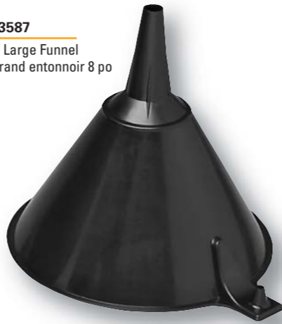
03587 8" Large Funnel Grand entonnoir 8 po