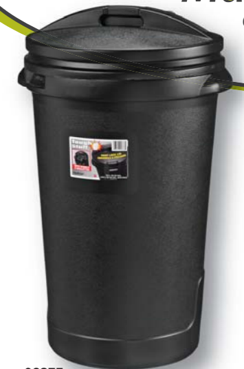
06275 77L/20 Gal Garbage Can - No Wheels Poubelle 77 L/20 gal sans roues