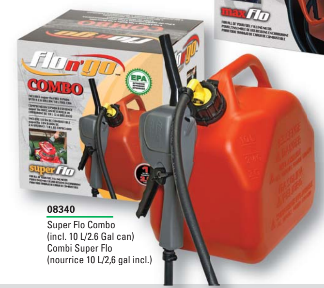
08340 Super Flo Combo (incl. 10 L/2.6 Gal can) Combi Super Flo (nourrice 10 L/2,6 gal incl.)