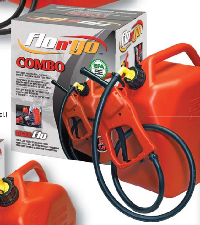
08341 Max Flo Combo (incl. 18.8 L/5 Gal can) Combi Max Flo (nourrice 18,8 L/5 gal incl.)