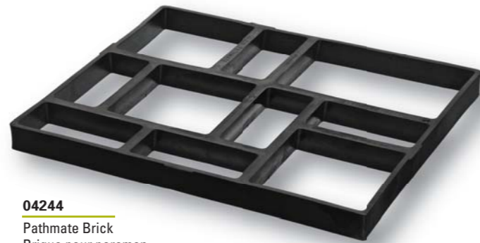
04244 Pathmate Brick Brique pour paremen