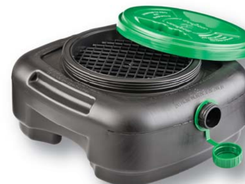
07029 6.6L/7 Qt Drain Container Récipient de récupération Qt 6,6 L/7