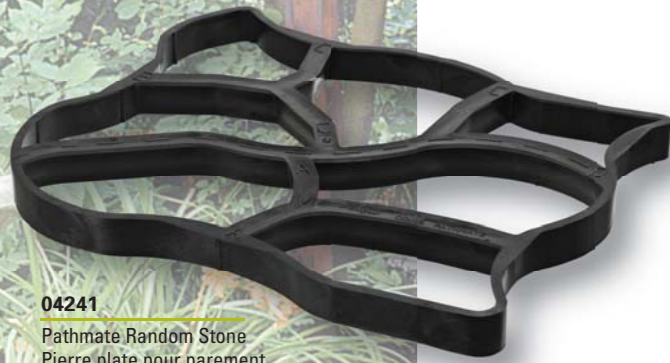
04241 Pathmate Random Stone Pierre plate pour parement