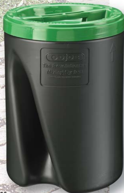
04239 ODJOB Mixing System Système de mélange ODJOB