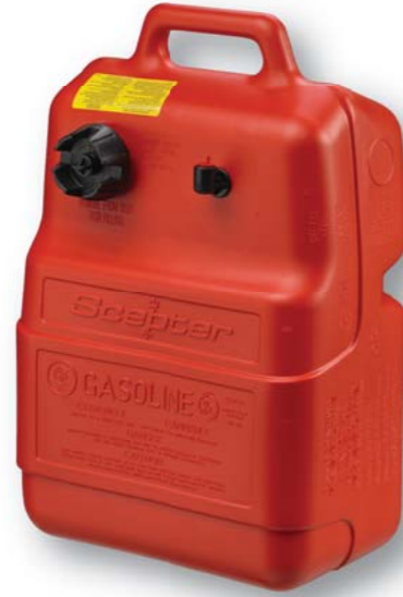
03776 6.6 Gal/ 25 L Scepter, No Gauge Scepter 6,6 gal/ 25 L, sans jauge