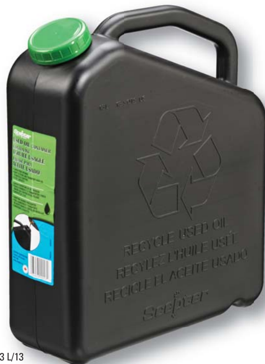
09243 13 L/ 13 Qt Used Oil Container Récipient d'huile usagée Qt 13 L/13