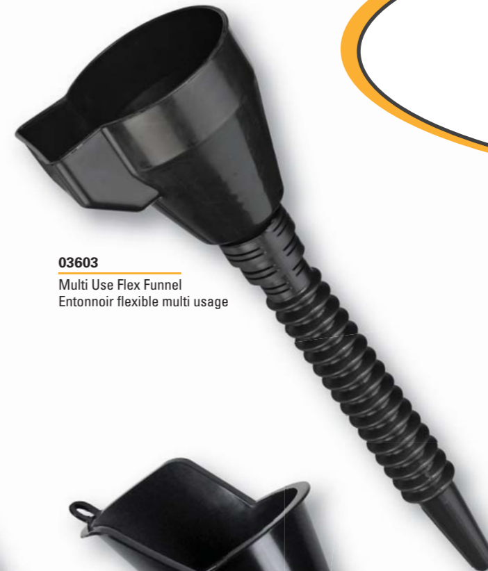
03603 Multi Use Flex Funnel Entonnoir flexible multi usage