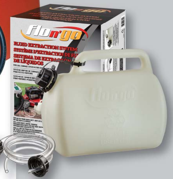
09644 Fluid Extraction System (incl. 8 L/2 Gal can) Système d'extraction de fluides (nourrice 8 L/2 gal incl.)