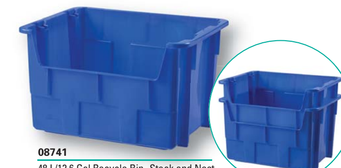
08741 48 L/12.6 Gal Recycle Bin- Stack and Nest Benne de recyclage 48 L/12,6 gal - empilable et emboîtable