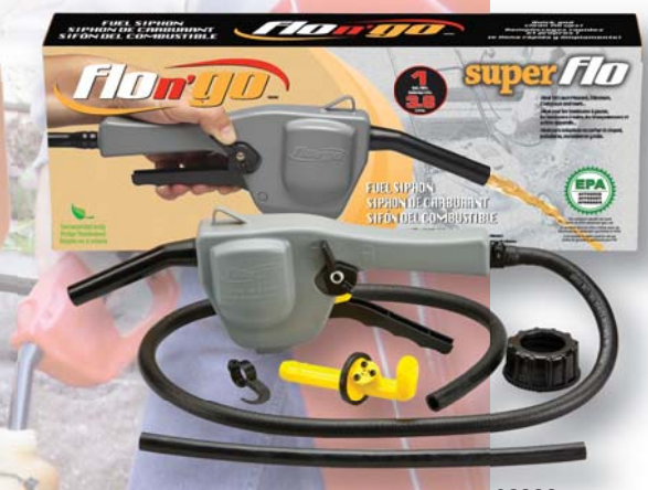
08339 Super Flo Siphon/Pump Siphon/Pompe Super Flo