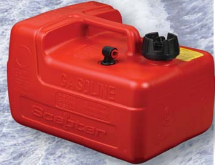
03773 3.2 Gal/ 12 L Scepter, No Gauge Scepter 3,2 gal/ 12 L, sans jauge