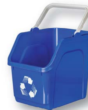
08743 25L Stack & Nest Recycle Bin Benne de recyclage gérable par rotation de 25 L