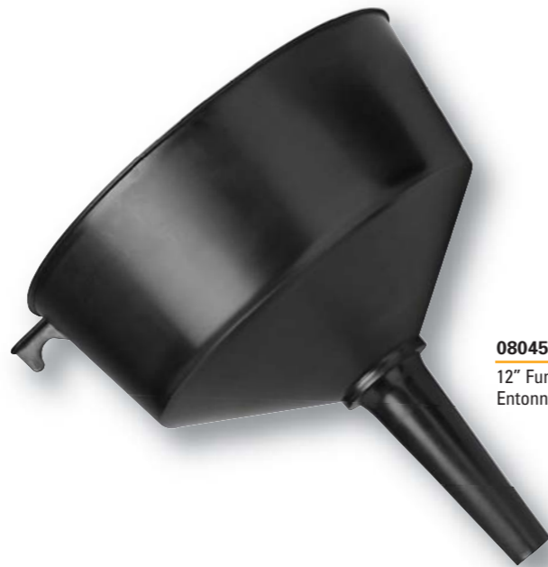
08045 12" Funnel Entonnoir 12 po