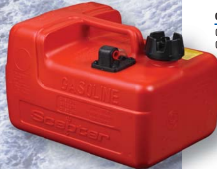
03780 OEM Choice! 3.2 Gal/12L Scepter C/W Gauge Option OEM! Scepter 3,2 gal/ 12 L avec jauge