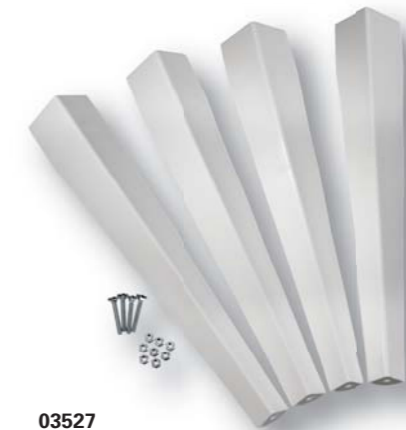
03527 Laundry Tub Leg & Hardware Kit Kit de quincaillerie et pied pour cuve de lessivage