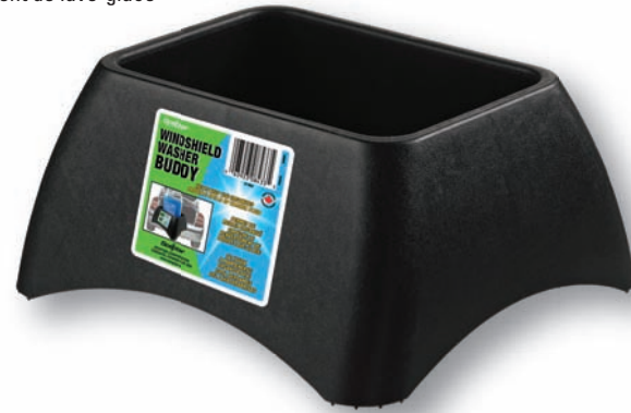
08433 Windshield Washer Caddy Compartment de lave-glace