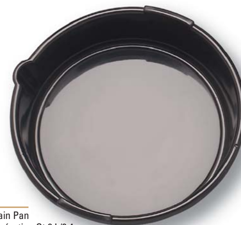
08261 8 L/8.4 Qt Drain Pan Bac de récupération Qt 8 L/8,4