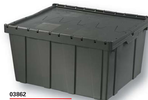
03862 Hinged Storage Container Récipient de transport à charnières