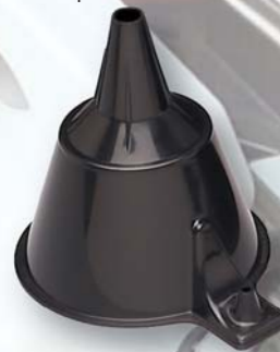
03588 4" Small Funnel Petit entonnoir 4 po