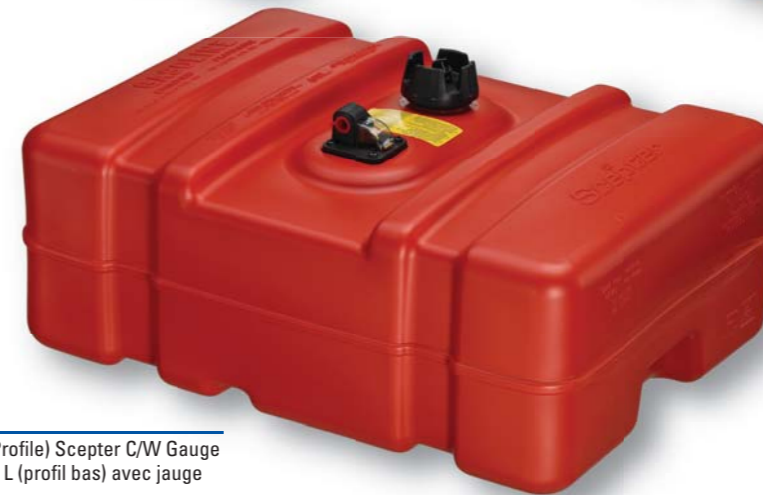
08191 12 Gal/45L (Low Profile) Scepter C/W Gauge Scepter 12 gal/45 L (profil bas) avec jauge