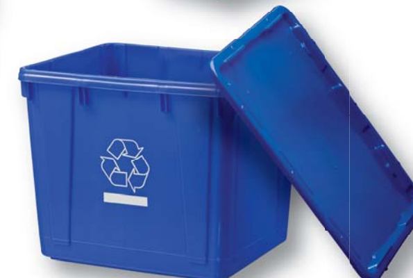
05949 59 L/15 Gal Recycle Bin Benne de recyclage 59 L/15 gal