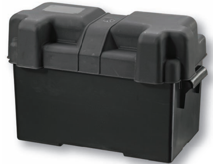
03797 Battery Box - Group 27 Boîtier de batterie - Groupe 27