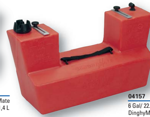
04157 6 Gal/ 22.7 L DinghyMate DinghyMate 6 gal/ 22,7 L