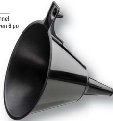
03589 6" Medium Funnel Entonnoir moyen 6 po