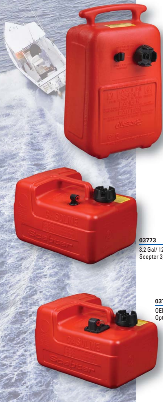
04921 6 Gal/22.7 L Neptune Neptune 6 gal/22,7 L