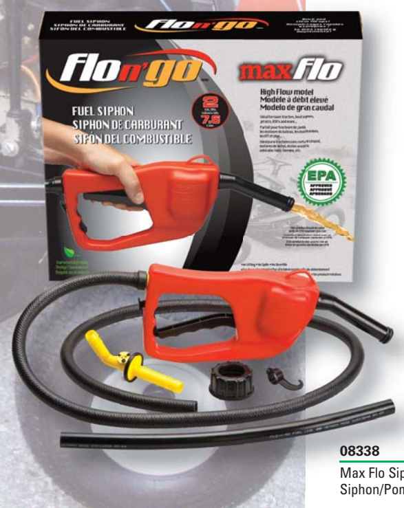
08338 Max Flo Siphon/Pump Siphon/Pompe Max Flo