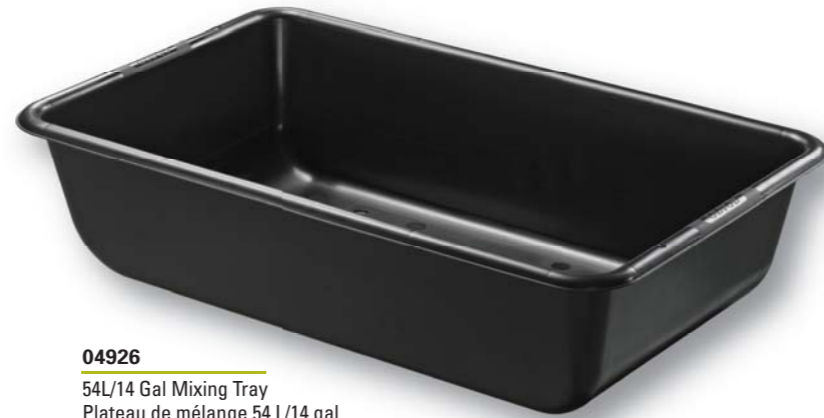
04926 54L/14 Gal Mixing Tray Plateau de mélange 54 L/14 gal