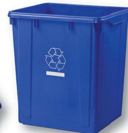
06186 90 L/24 Gal Recycle Bin Benne de recyclage 90 L/24 gal