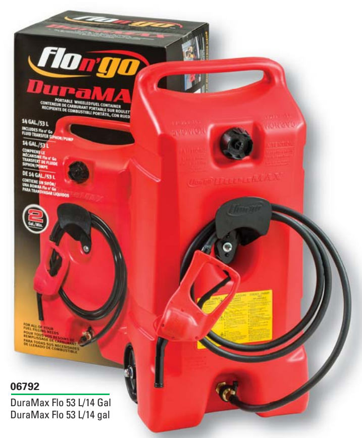
06792 DuraMax Flo 53 L/14 Gal DuraMax Flo 53 L/14 gal