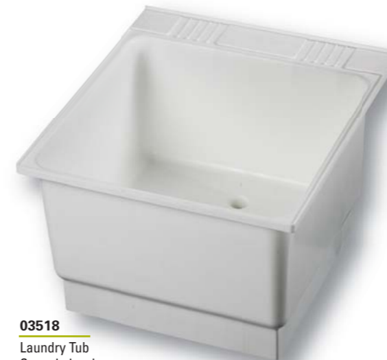
03518 Laundry Tub Cuve de lessivage