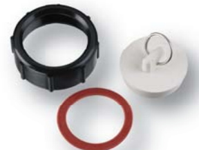
03526 Laundry Tub Hardware Kit Kit de quincaillerie pour cuve de lessivage