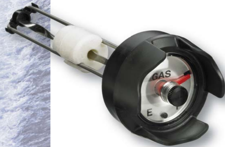
08936 Combi Cap Gauge for 6 Gal Tanks Jauge à bouchon combi pour cuves de 6 gal