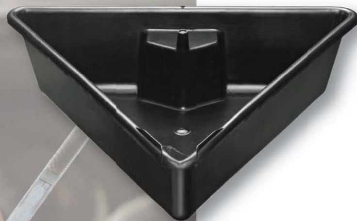
08260 9 L/9.5 Qt Drain Pan Bac de récupération Qt 9 L/9,5