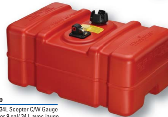
08189 9 Gal/34L Scepter C/W Gauge Scepter 9 gal/ 34 L avec jauge