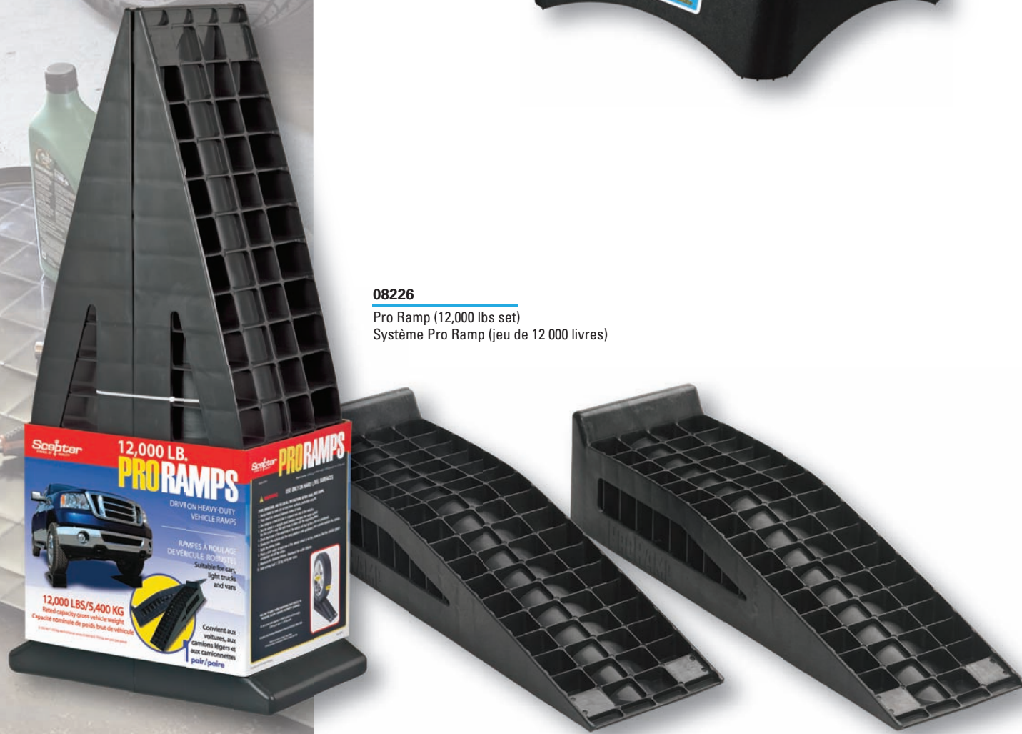
08226 Pro Ramp (12,000 lbs set) Système Pro Ramp (jeu de 12 000 livres)