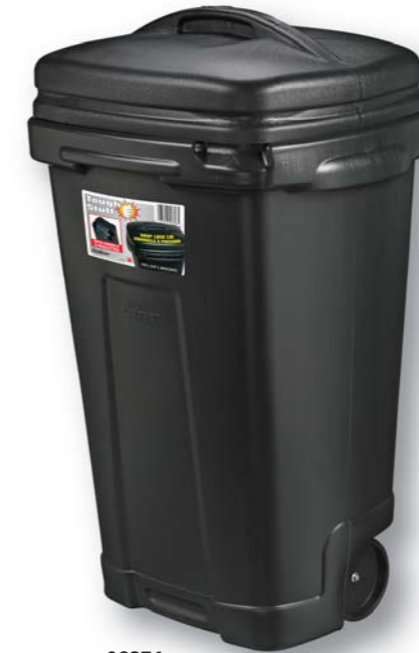
06271 133L/35 Gal Garbage Can with Wheels Poubelle 133 L/35 gal avec roues