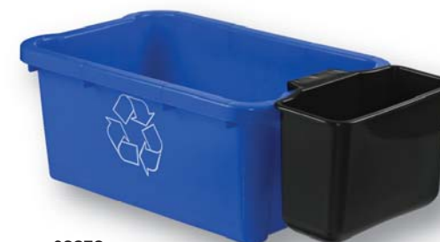
03875 Saddle Tote Waste Bin Benne à ordures avec système inclinable