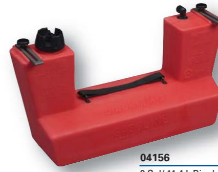
04156 3 Gal/ 11.4 L DinghyMate DinghyMate 3 gal/ 11,4 L