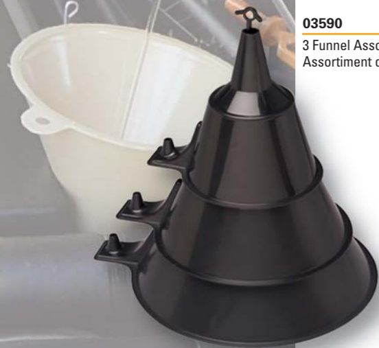
03590 3 Funnel Assortment Assortiment de 3 entonnoirs