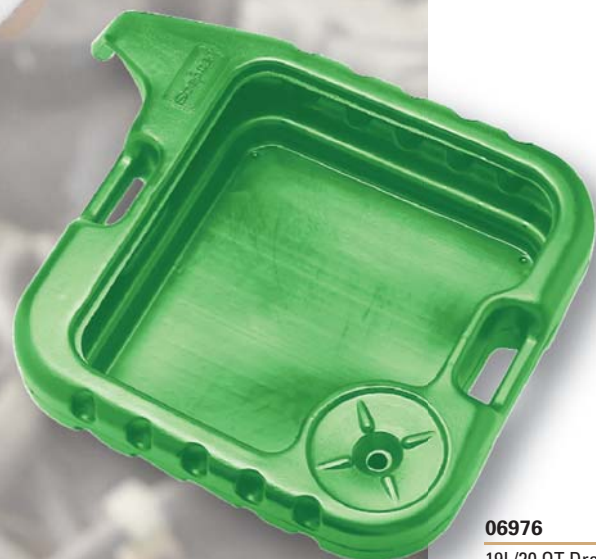
06976 19L/20 QT Drain Pan, Antifreeze Bac de récupération Qt 19L/20, Antigel