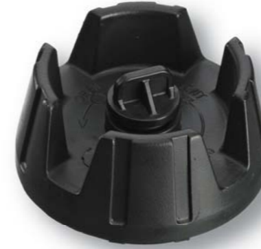
08935 Vented Cap fits Most Tanks - Display Bouchon d'évent adapté à la plupart des cuves - Écran