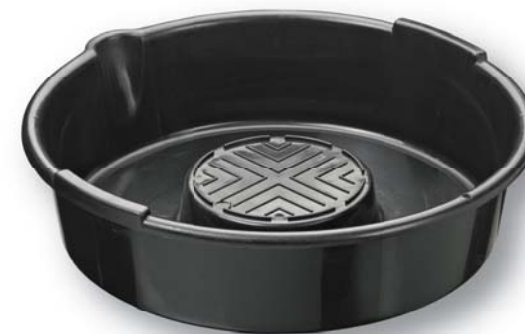
03896 7.5 L/8 Qt Drain Pan Bac de récupération Qt 7,5 L/8