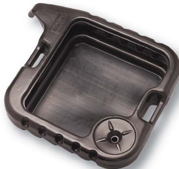
06985 19 L/20 QT Drain Pan Bac de récupération Qt 19 L/20