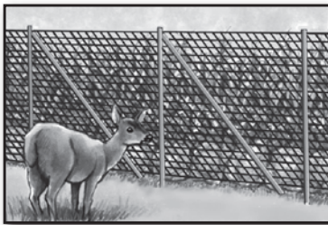
Protect Gardens Proteger jardines